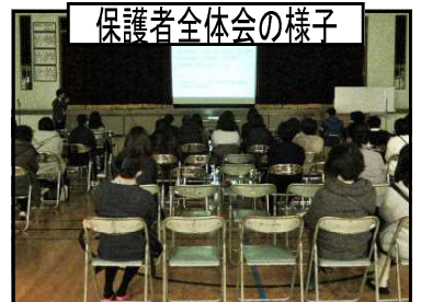
保護者全体会の様子

さて、昨年度より、保護者の皆様の参加しやすさを考慮し、家庭教育講座と保護者全体会を同日実施いたしました。全体会では、本校の学力に関する状況について、学力向上のポイント等の説明を中心に、生徒指導のお願いも含めて、教務主任よりお話をいただきました。その際にご紹介した「ちばっ子チャレンジ100」のサイトは、下記のURLとなります。または「ちばっ子チャレンジ100」で検索してください。