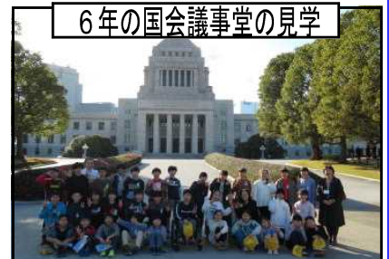
6年の国会議事堂の見学

1月30日に、6年生がキッザニア東京・国会議事堂に校外学習に行ってきました。キャリア教育及び社会科見学を実施するためですが、小学校最後の校外学習、今まで学んできたことを実践する場でもあります。キッザニア東京では一人一人が百種類以上の仕事やサービスの中から自分が体験したいことを選択し、自分の計画で行動しました。最高学年として誇らしい態度でした。卒業まであと少し、下級生にたくさんのことを教えてほしいと思います。