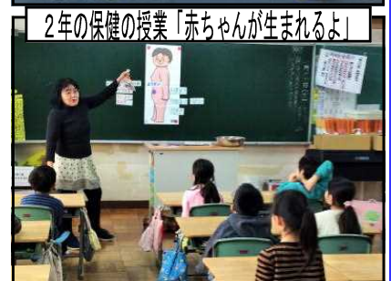
2年の保健の授業「赤ちゃんが生まれるよ」

1月に養護教諭による保健の授業が行われました。養護教諭の職務の一つに保健教育があり、各学年で担任と共に授業をしたり、集会で「感染症予防」について全校児童に啓発したりしています。2年生の「赤ちゃんが生まれるよ」では、まず、お母さんのおなかの中で赤ちゃんが育つしくみを学びました。子宮、胎盤、羊水、ワジナなどの新しい言葉を教えてもらい、0.1mmの卵から、身長8cm体重20gの3カ月の胎児、体重1kgの6カ月の胎児へと成長する様子がわかる人形にふれて大きさや重さを実感したり、大きくなる仕組みを学んだりしました。お母さん人形を使って双子を出産する様子やへそのおを切る様子を勉強した時は、教室に「えー！！」という驚きの声が響いていました。先生から抱き方を教えてもらった10カ月3kgのあかちゃん人形を休み時間になっても抱いている子どもたちがいました。この学習は、2年生の生活科で自分の成長を振り返る「自分はっけんブック」の学習とつながっていきます。愛されている自分、成長した自分を感じる温かい時間です。生まれるのを楽しみに待っていてくれたご家族やたいへんな思いをして生んでくれたお母さんの思いを想像しどの子もすてきな感想を書いていました。一部を紹介します。