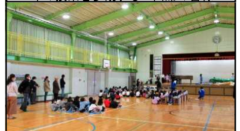
2年の授業を参観するご出席の皆様

当日は、地域の自治会長や民生委員児童委員の皆様など、30名近いお客様が来校し、全学級の授業の様子をご参観くださいました。参観後にいただいたアンケートには、「みんな元気いっぱい、授業に集中していた。先生方のひきつけ方がとても上手で、取り残されている子がいなかった。」「明るく元気な子どもを育てるために、今後も頑張ってもらいたい。西初石小は、市内でも一番の環境であると思う。今後も明るい学校であってほしい。」などのお褒めの言葉とともに、「校外での元気な挨拶が、まだできていないように思います。地域の大人たちからも働きかけが必要だと思うので、努力したいものです。」などのご指摘をいただくこともでき、有意義な一日となりました。