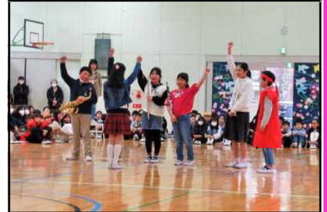
ぐんぐん発表会（5年生）の様子

最後に、本校では毎年全学年で学級編制（クラス替え）をしています。卒業する6年生はもちろんのこと、進級を前にどの学年の児童も今の学級の仲間や担任の先生とお別れです。1年間を振り返って、感謝する気持ちを大切にしてほしいと思います。人間は一人では生きられません。学校では、折に触れ、仲間のよいところを見つける活動やご家族に思いはせるような活動を行ってきました。子どもたちの心の成長に連れ、周りを見て気づくことが多くなってきます。うれしいことも悲しいこともいろいろなことがあった1年間、自分たちを支えてくれた人に「ありがとう」と素直な感謝の気持ちを伝えてほしいと思います。