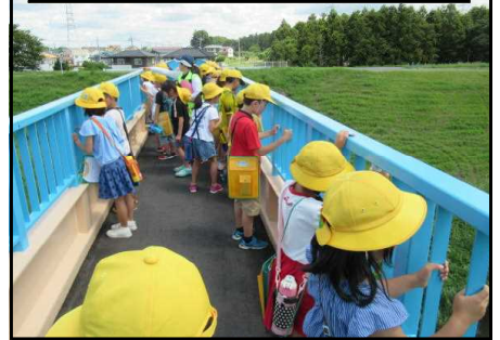
3年市内めぐり 利根運河見学

6月18日に3年生が市内めぐりに行きました。3時間ほどかけて、バスと徒歩で市内をめぐります。新川耕地の水田、流山工業団地、水運で栄えた利根運河、市内最初のアーケード江戸川台商店街、発展するおたかの森駅の周辺、南流山、旧街道の古い町並み。子どもたちは、事前に学習したことをひとつひとつ自分の足で歩いて、目で見て確認していきます。3年生が初めて書いた新聞の一部をご紹介します。