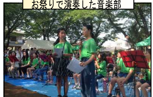
お祭りで演奏した音楽部

夏季休業中にも、たくさんの子どもの活躍がありました。7月27日には第一住宅のお祭りでは、 お客様を前に音楽部が「マイウエイ」「学園天国」などを演奏させていただきました。音楽部の発表にあたって は、連日保護者の皆様が教員とともに指導に当たってくださり、演奏技術も向上しました。