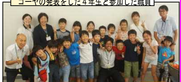
ゴーヤの発表をした4年生と参加した職員

8月7日には、4年生代表児童が「ゴー ヤ研究所」と銘打って、流山市ゴーヤクラ ブ主催の「ゴーヤの集い」で、研究の成果 を発表しました。ゴーヤは本当に空気をきれいにしているかという実験やゴーヤが日本 全体に普及するまでの歴史など、大人も 知らない深い内容に、会場にいた方々も感 心していました。この他にも、市で募集し た能登自然体験ツアーに応募し、親元を離れ一人他の学校の児童と3泊4日の宿泊体験をした 児童、平和大使として流山市を代表して広島を訪問した児童、書生会で入賞した児童等夏休み 中の子どもたちの活躍がたくさん聞かれました。