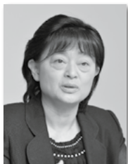
学校教育部指導課 課長