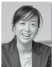
学校教育部指導課 指導主事

千葉県内の公立中学校教諭、教頭、流山市教育委員会指導主事などを経て、2016年度から現職。