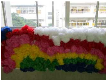
きれいなろうかの飾り