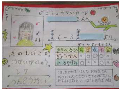
1年生ひとりひとりへ6年生からの自己紹介カード