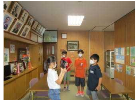
1年生への動画作成の一場面です！