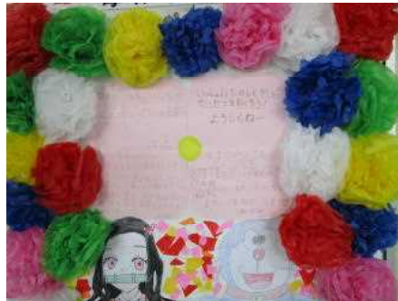
1年生へのメッセージ