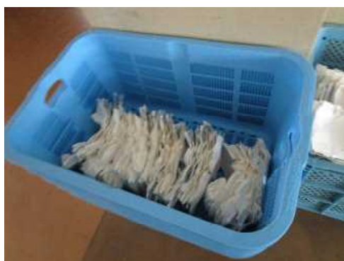
クラスごとにたばねて箱に入れ、リサイクル業者に出します

今年度4月より、流山市内の小中学校が一斉に、牛乳の紙パックを学校で一つ一つ開き、洗い、乾かして、リサイクルに出すこととなりました。