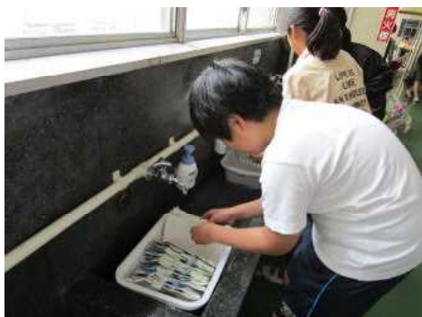
みんなが開いたパックを洗っているところです