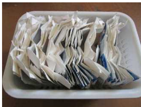
クラスの1日分をこのようにして乾かします