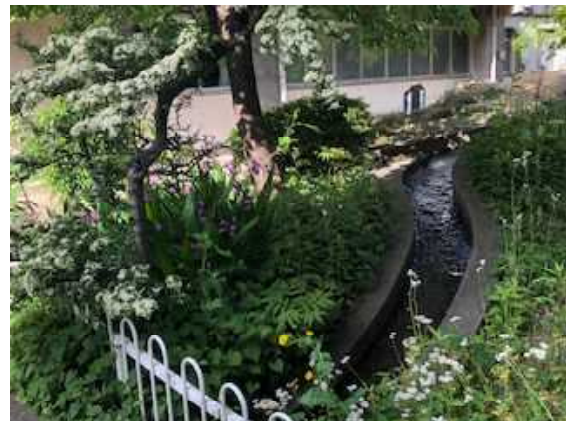
水の流れに心がいやされます