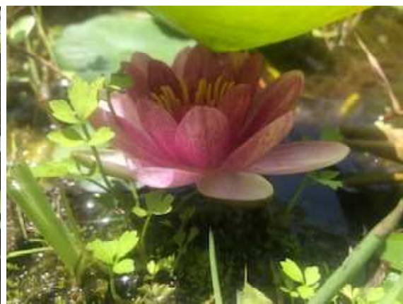
お昼前、花が開きました！