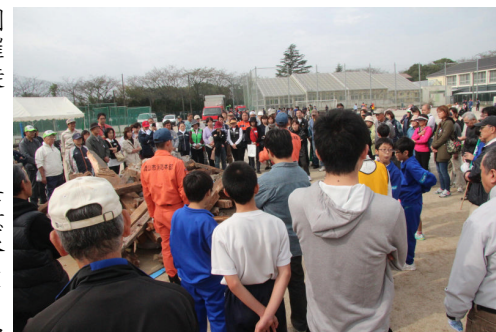
瓦礫の下からの救出場面

10月22日(土)に、東部地区学校地域合同防災訓練が実施されました。今年度は、地域主催で実施されました。各自治会から550名、生徒140名、合計690名が訓練に参加しました。この訓練は今年で4年目となりますが、毎年、少しずつメンバーがかわりながら継続して実施されており、様々なコンテンツを体験した方々が毎年確実に地域に増えているという点はたいへん意義のあることと思います。また、今年度地元木谷工業のご厚意で瓦礫からの救助について学ぶことができました。道路が寸断され、レスキュー隊も消防車も入れないとき、頼りになるのは住民の力との説明は、たいへん説得力がありました。