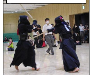
親善試合の1シーン

「WITH コロナ」の中であっても、精一杯試合を楽しみ、心身の成長のために行っている部活動から、多くのことを学んでほしいと思います。