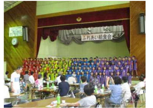
↓4年 ふれあい給食会での発表