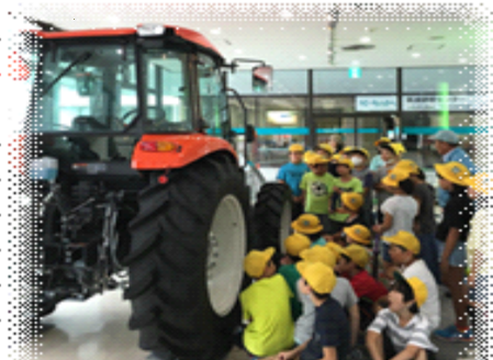
↑ 15年 クボタ工場