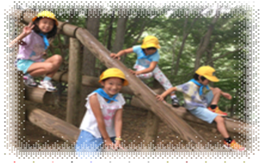
↑ 2年 アンデルセン公園