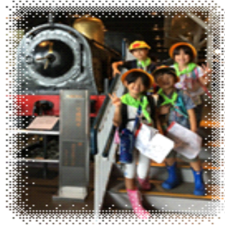
↑ 1年 鉄道博物館

生活の中には、友達間での失敗、生活面や学習面での失敗など、さまざまな失敗(うまくいかないこと)が潜んでいます。親として叱ったり小言を言ったりという日常だと思えます。でも、見方を変えれば、失敗は大きく成長するきっかけとなります。失敗を恐れて、何もしないのであれば乗り越える力もがんばる力も高まりません。私は、積極的にがんばって起こる失敗は、成長の糧になると子ども達には伝えていきます。たくさんの取り組みが多くなる10月です。「失敗に乾杯！」の気持ちを大切にしたいです。